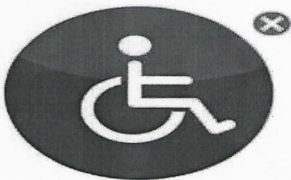
ANTIGUO SÍMBOLO DE "DISCAPACIDAD"

Símbolo Accesibilidad Universal O.N.U. Unidad de Diseño Gráfico Departamento de Información Pública