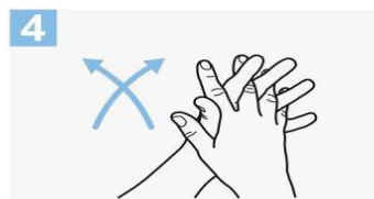
4 Frótese las palmas de las manos entre sí, con los dedos entrelazados;