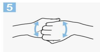
5 Frótese el dorso de los dedos de una mano con la palma de la mano opuesta, agarrándose los dedos;