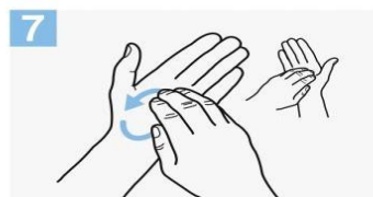
7 Frótese la punta de los dedos de la mano derecha contra la palma de la mano izquierda, haciendo un movimiento de rotación y viceversa;