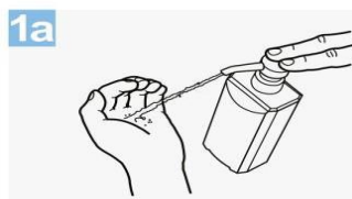
1a Deposite en la palma de la mano una dosis de producto suficiente para cubrir todas las superficies;