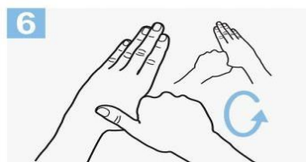
6 Frótese con un movimiento de rotación el pulgar izquierdo, atrapándolo con la palma de la mano derecha y viceversa;