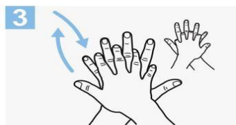
3 Frótese la palma de la mano derecha contra el dorso de la mano izquierda entrelazando los dedos y viceversa;