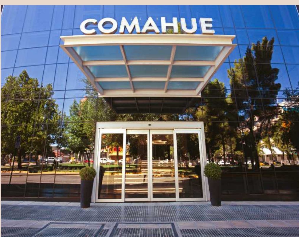
Fachada actual del Hotel Comahue luego de las transformaciones del año 2022

Con estilo propio, nuestro diseño refleja la esencia de la ciudad en la que se encuentra, ofreciendo experiencias únicas e inolvidables para quienes nos visitan.